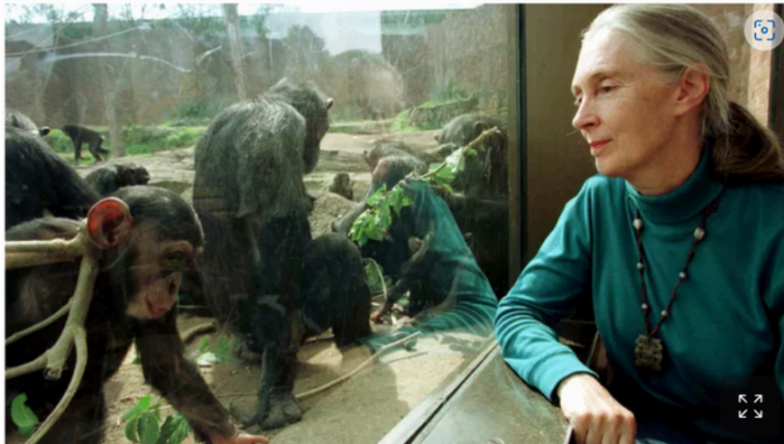
La Dr. Jane Goodall, chercheuse sur les chimpanzés et naturaliste, observe à travers une vitre certains des 25 membres de la colonie de chimpanzés du zoo de Taronga à Sydney.

Le monde entier réagit au décès de la célèbre primatologue britannique Jane Goodall, figure emblématique de la cause environnementale et ambassadrice des chimpanzés.