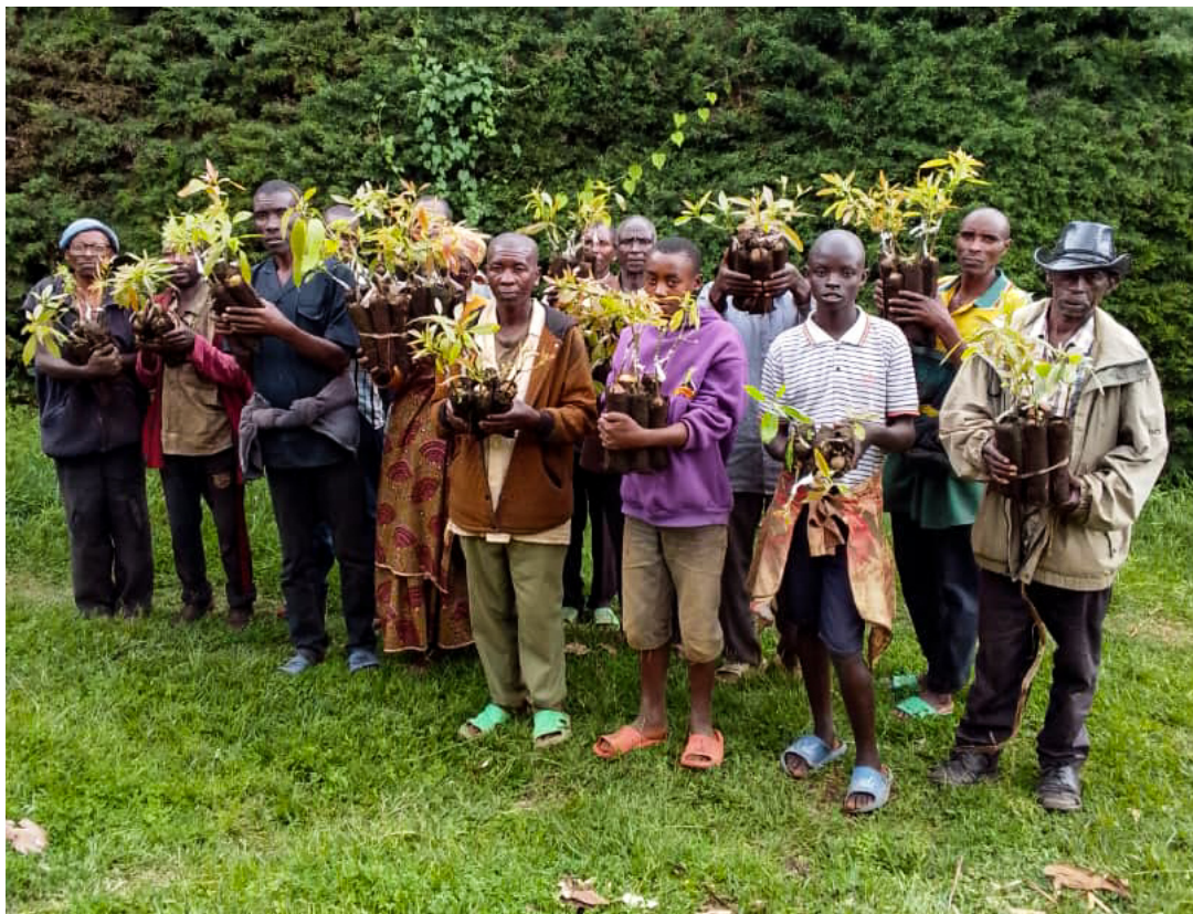
DAM, NY, AGNEWS, https://burundi-agnews.org , Jeudi 13 mars 2025 | Photo : 3C