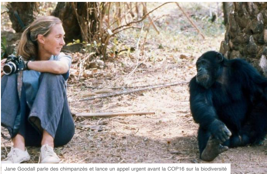
Jane Goodall parle des chimpanzés et lance un appel urgent avant la COP16 sur la biodiversité

L'objectif de la COP16 est clair : protéger 30 % des terres et des mers d'ici 2030. Cependant, Jane Goodall insiste sur le fait que la lutte pour la biodiversité ne se limite pas aux gouvernements, mais implique chacun d'entre nous. Nous avons tous un rôle à jouer pour changer la trajectoire actuelle.