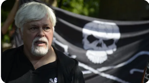
Épisode 1/8 : Paul Watson, pirate engagé