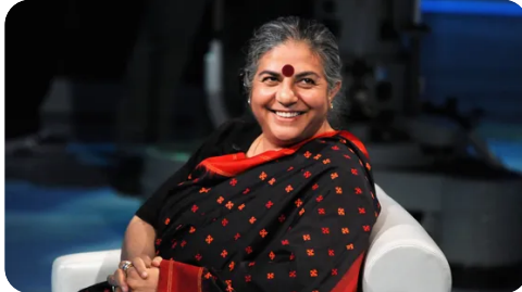
Épisode 2/8 : Vandana Shiva, les souvenirs d'une femme de combat