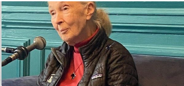
Jane Goodall, Paris octobre 2024