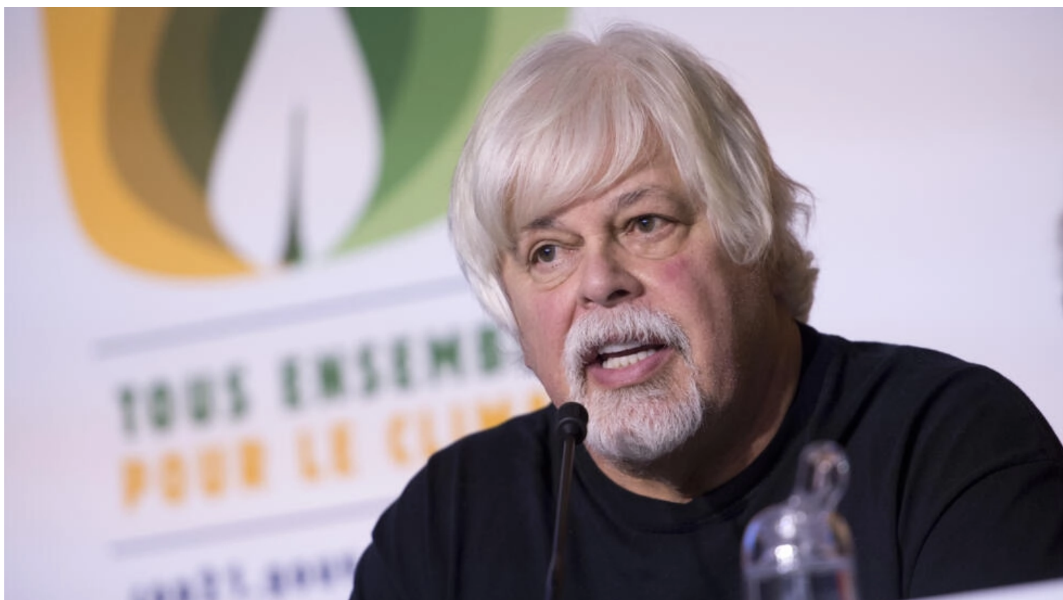
Paul Watson lors d'une conférence de presse le 10 décembre 2015 à Paris en marge de la COP21