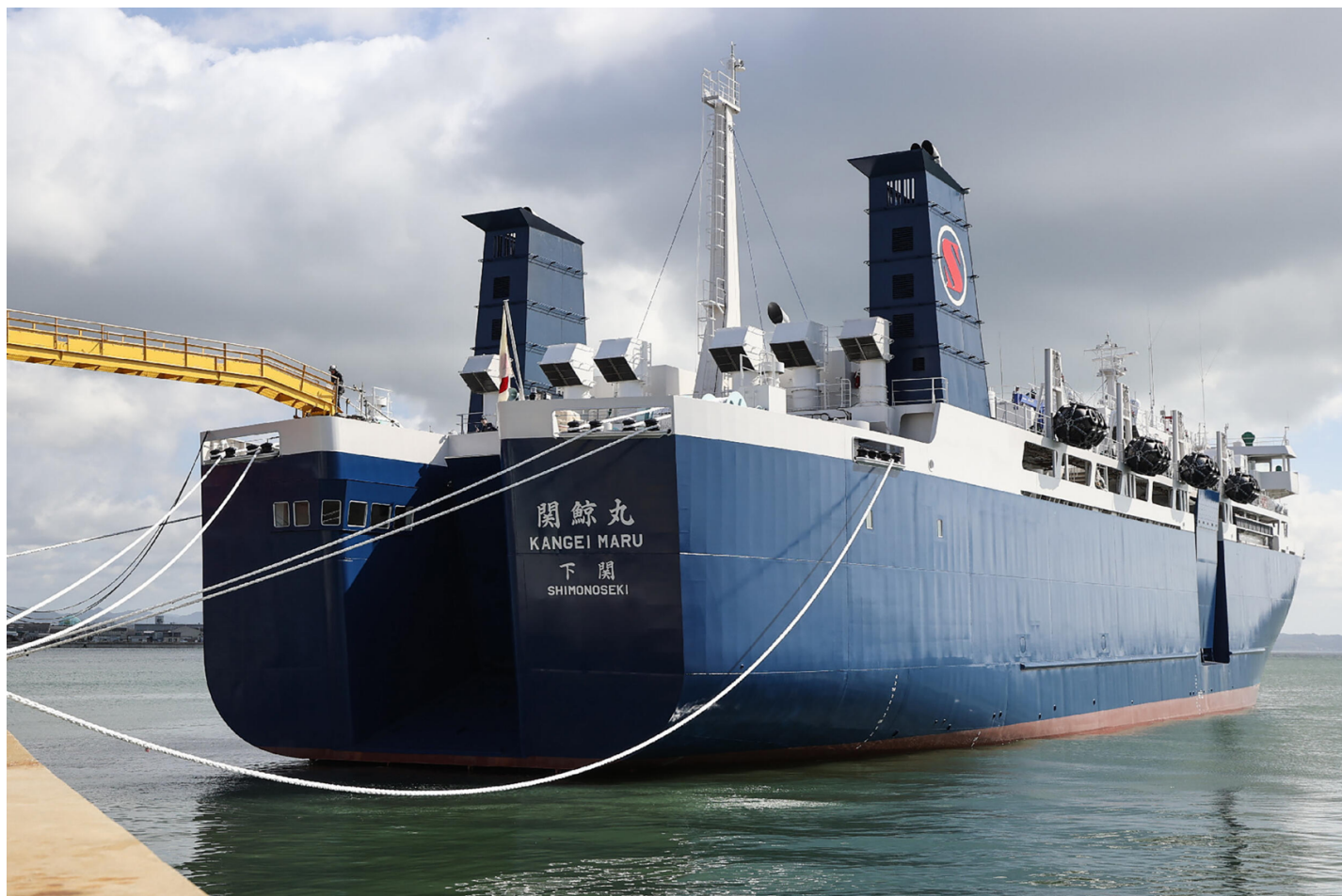
Le Kangei Maru, navire-usine baleinier en phase de test au large de la ville de Shimonoseki dans le sud du Japon le 8 mai 2024

Il a été placé en détention jusqu'au 15 août, date à laquelle la Haute cour du Groenland prendra une décision sur une prolongation ou non de cette privation de liberté après un appel formulé par le militant et ses avocats.