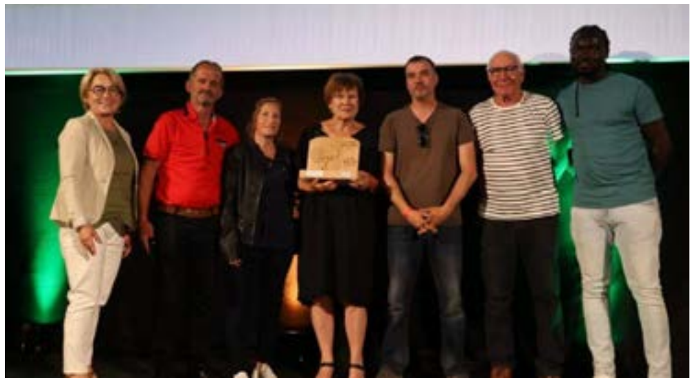
Le premier prix de l'Appel à initiative citoyenne de la Région Grand Est a été remis aux Jardins partagés nourriciers de Neuves-Maisons.