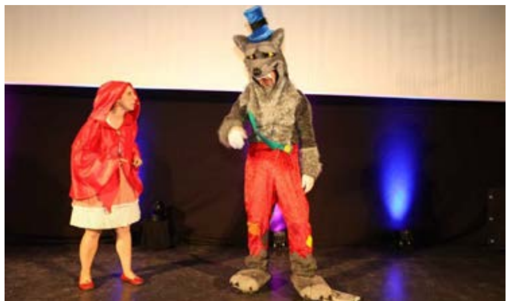
La cérémonie de remise des prix, le 2 juin, a été ponctuée d'interventions théâtrales de La Salamandre bleue autour de thèmes liés à l'environnement.