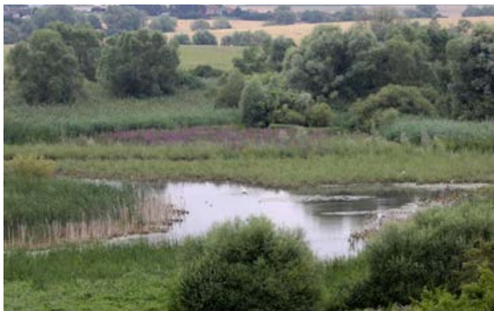
Le marais de Droitaumont est un espace naturel sensible, près de Jarny, dans le Pays-Haut-meurthe-et-mosellan.

« En Lorraine, nous sommes dans une grande zone humide car les dépressions marneuses retiennent l'eau. Au Moyen-Âge, les moines ont construit des digues pour y mettre des poissons. La région est vraiment privilégiée. »