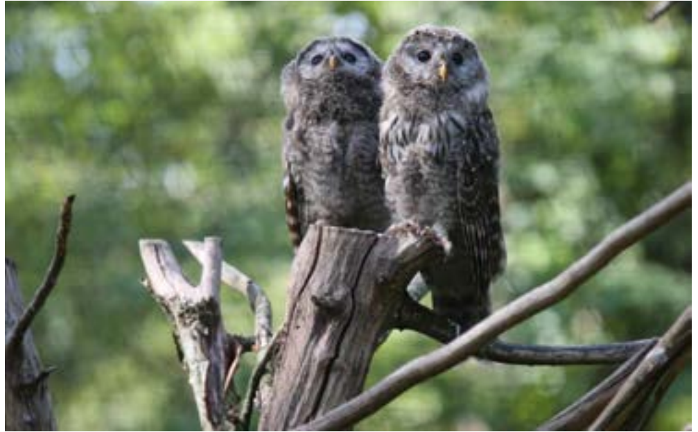
Les chouettes de l'Oural ont fait des petits à Rhodes. Le parc est mobilisé depuis des années dans des programmes de préservation d'espèces menacées.