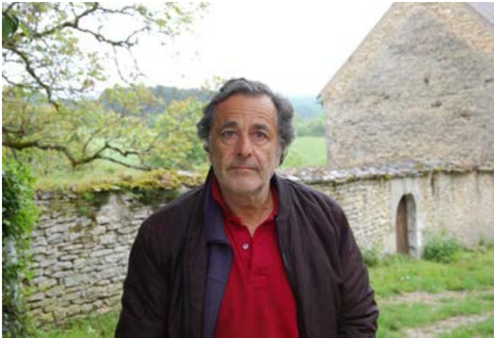
Nicolas Vanier est aventurier, écrivain et réalisateur.