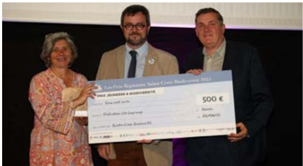
Dans la catégorie jeunesse et biodiversité, le troisième prix a été décerné à la Fédération Léo-Lagrange.