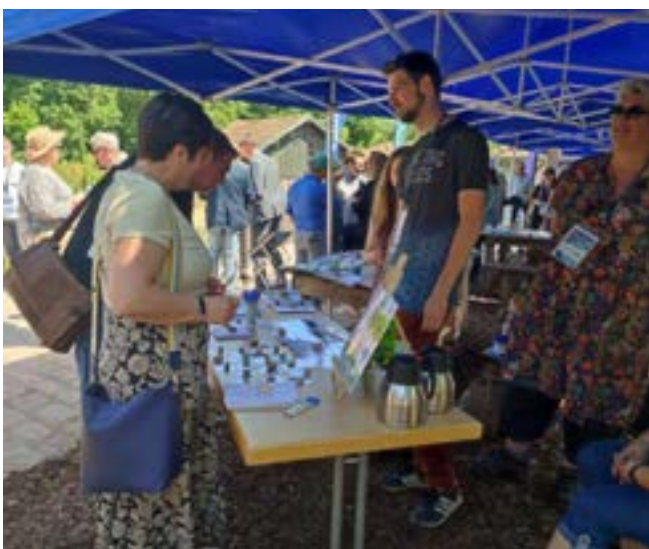
Le village de la biodiversité proposait différents stands au public tout au long de la manifestation.