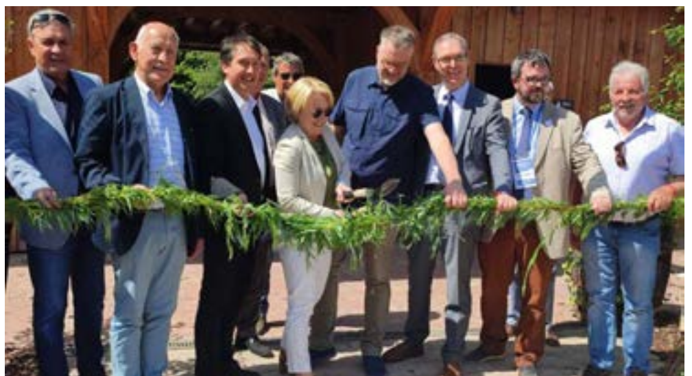
L'inauguration du village de la biodiversité a eu lieu en présence de nombreuses personnalités.