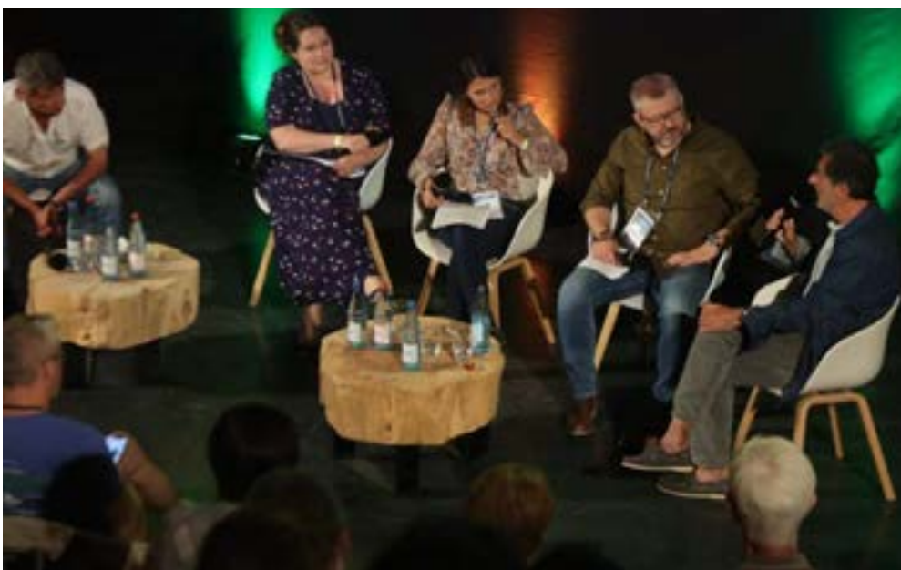
Nicolas Vanier était, le 4 juin, l'invité d'honneur des Entretiens de la biodiversité au parc de Sainte-Croix. Il a animé une conférence-débat.