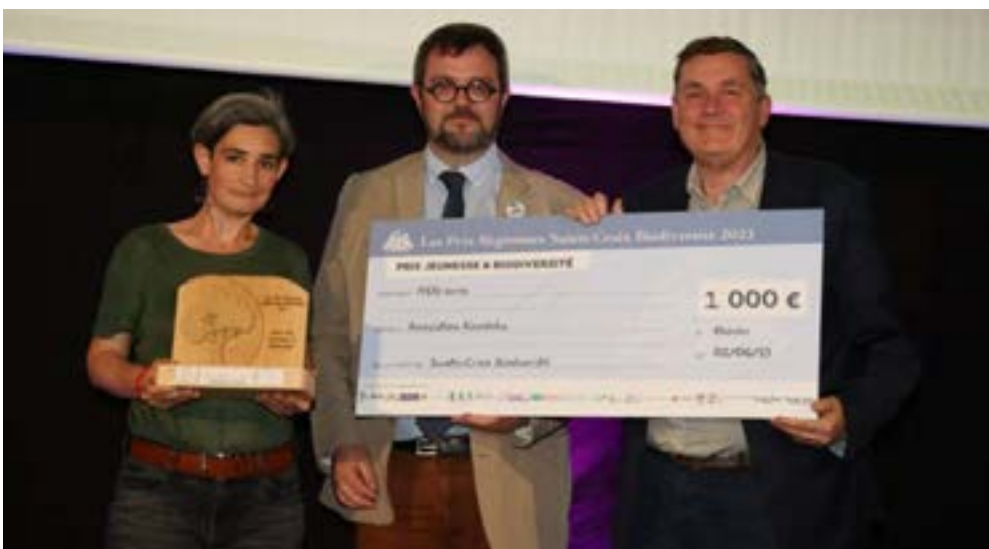
Le projet de l'association Kinodoka remporte le deuxième prix dans la catégorie jeunesse et biodiversité.