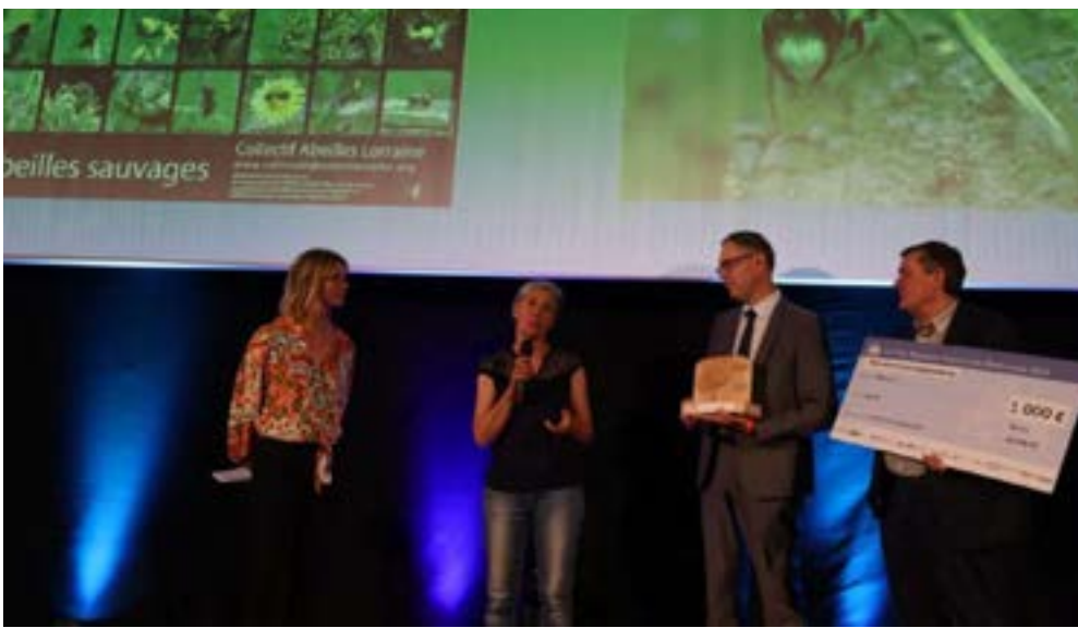
Dans la catégorie initiatives collectives et biodiversité, le deuxième prix est décerné à Apicool : le collectif Abeilles Lorraine.