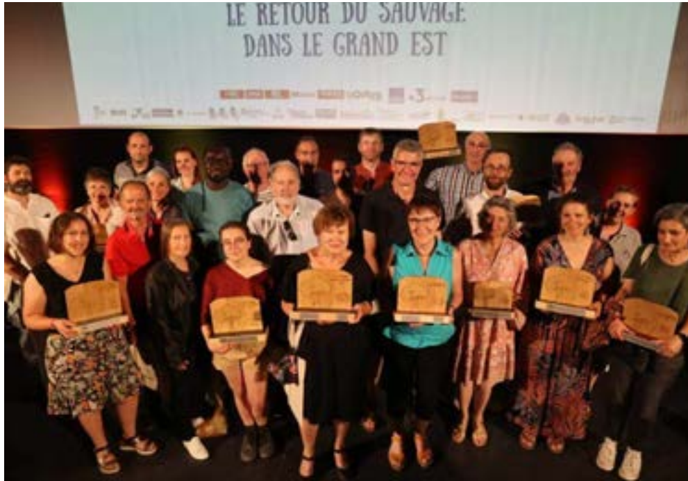
Quinze trophées régionaux ont été remis en ouverture des Entretiens de la biodiversité.