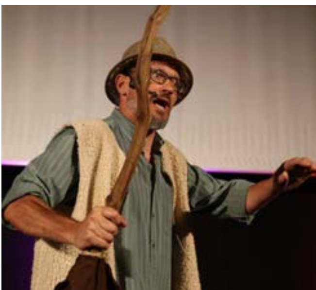
La compagnie La Salamandre bleue a assuré une bonne ambiance le vendredi 2 juin à Rhodes.