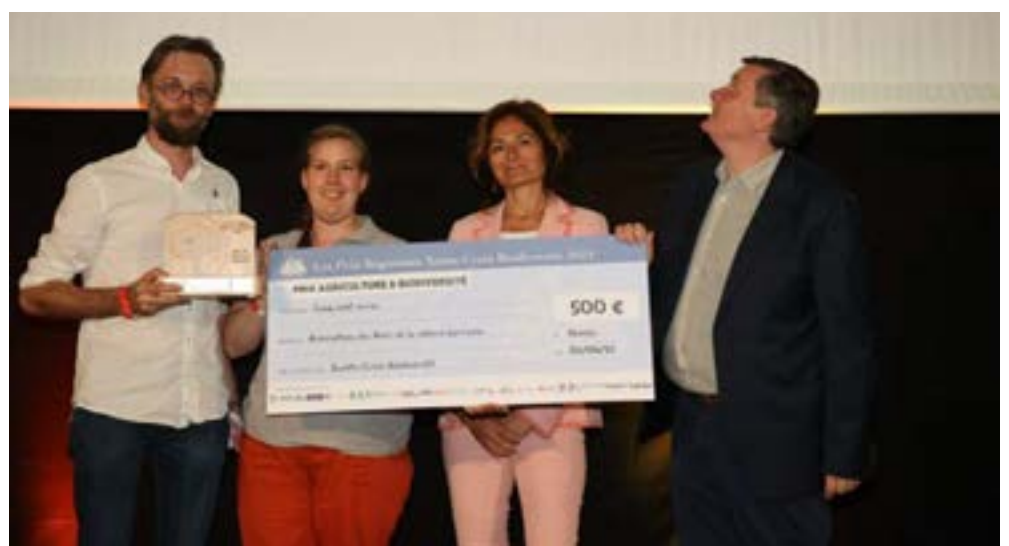
L'association de la chèvre lorraine a reçu le troisième prix Sainte-Croix biodiversité dans la catégorie agriculture et biodiversité.