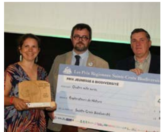
Le 1 er prix dans la catégorie jeunesse et biodiversité a été remis au projet Explorateurs de la nature.