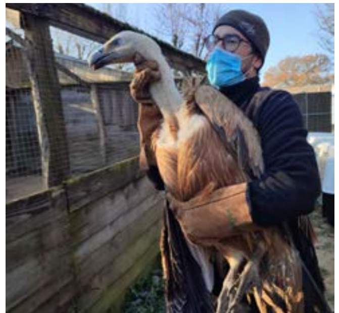
Quand on évoque la réintroduction, on pense aussi aux rapaces et notamment au vautour.