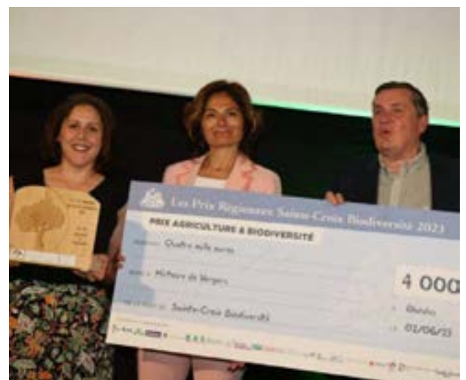
Histoire de vergers a reçu le premier prix dans la catégorie agriculture et biodiversité.