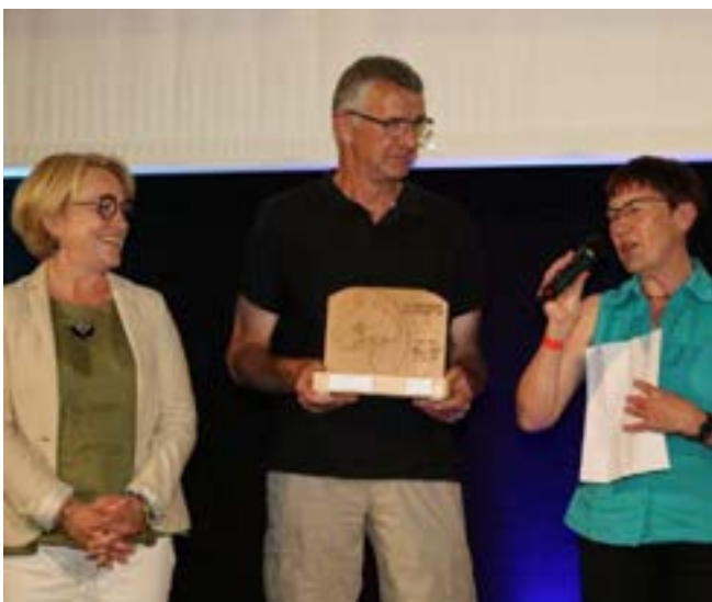
Catégorie appel à initiative citoyenne : le 2 e prix est remis à Oasis par la Région Grand Est.