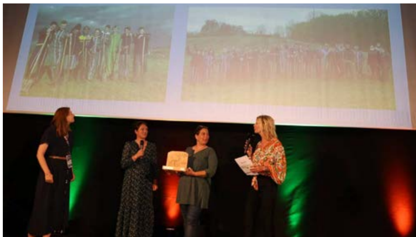
Le prix Roots et Shoots Jane Goodall a été décerné au lycée agricole de Château-Salins.