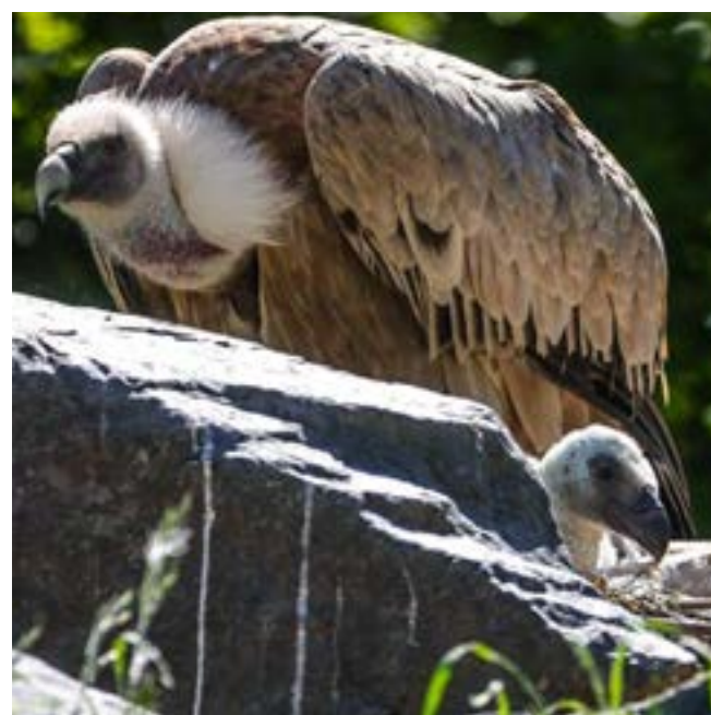
Le principal problème de la réintroduction est celui de l'acceptation des animaux sauvages, comme ici le vautour, par les humains.