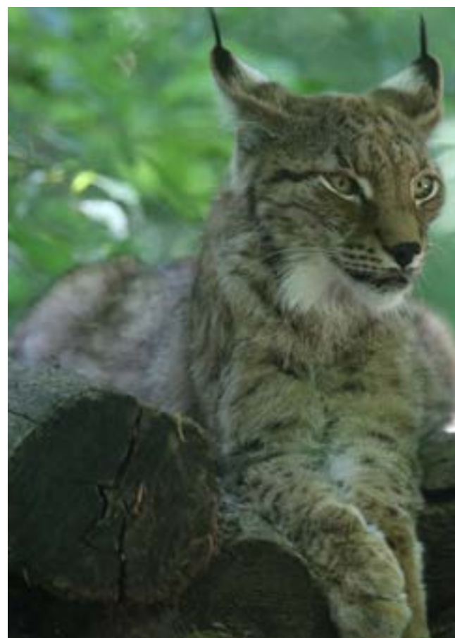
Le lynx est en danger critique d'extinction dans le Grand Est.

Seulement huit lynx étaient présents en 2021-2022 dans les Vosges et cinq dans le Jura alsacien. Donc treize individus en France. Un seul cas de reproduction a été observé dans les Vosges du Nord.