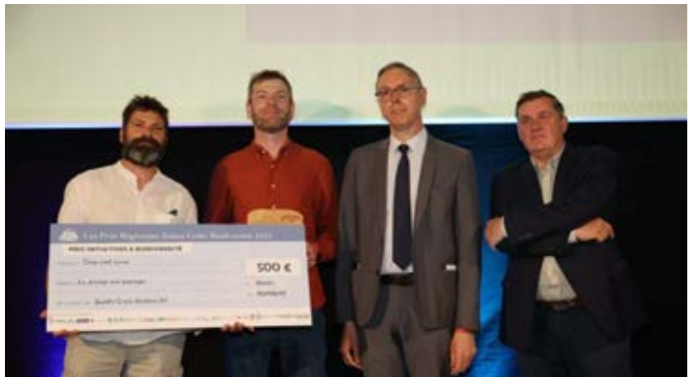
Dans la catégorie initiatives collectives et biodiversité, le troisième prix est remis à la Grange aux paysages pour la protection du retour du castor sur son territoire.