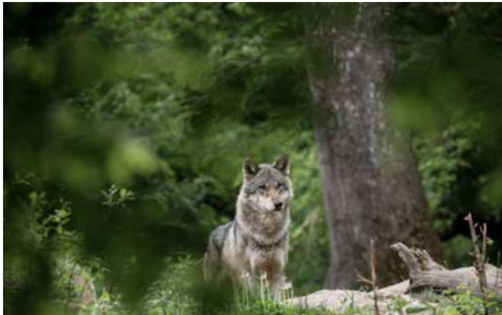
Une table ronde consacrée aux grands carnivores dans le Grand Est a conclu la seconde journée des Entretiens de la biodiversité 2023.