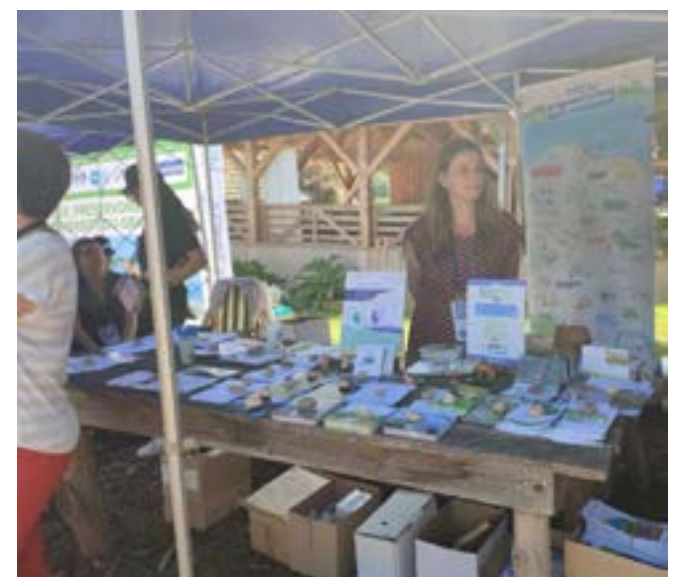
Le village de la biodiversité proposait différents stands au public tout au long de la manifestation.