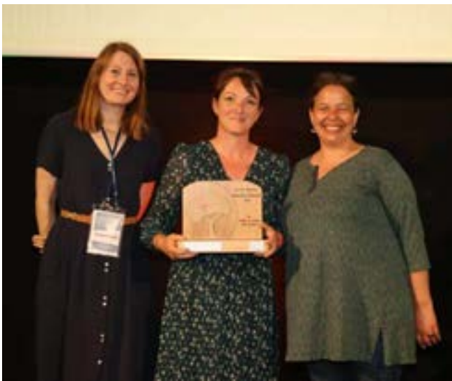
Le prix Roots and Shoots Jane Goodall revient au lycée agricole de Château-Salins.