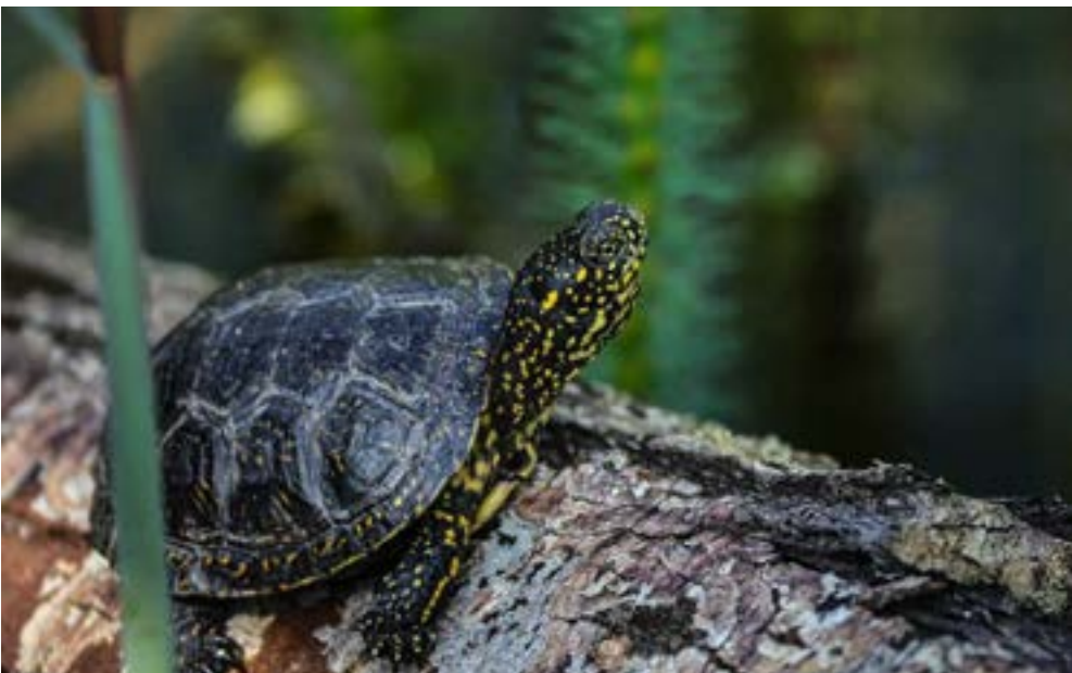
La réintroduction de la cistude sur le territoire est l'une des actions du Grand Est. Cette espèce de tortue vit dans les zones humides.