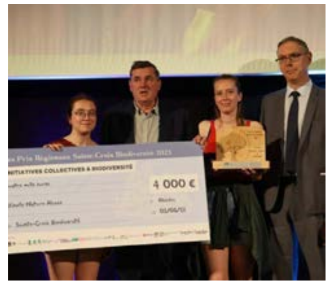
Dans la catégorie initiatives collectives et biodiversité, le premier prix revient à l'association Sentinelle Nature Alsace.