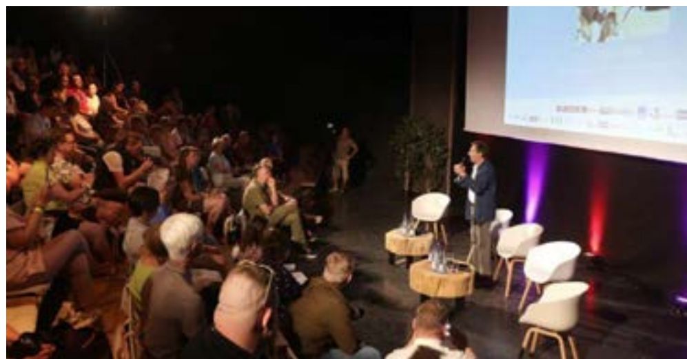
Nicolas Vanier était l'invité d'honneur des Entretiens. Il a échangé avec le public et les médias à l'issue d'une conférence pour clôturer les débats.

Le monde change, le climat aussi. Mais l'invité d'honneur, Nicolas Vanier, explorateur et réalisateur de film, a lancé un avertissement clair : « L'heure n'est plus aux études mais à l'action ! Il ne s'agit pas de sauver la planète, car la planète ira très bien, mais de nous sauver nous-mêmes ! » Comment ? « Je ne crois pas aux États, je crois