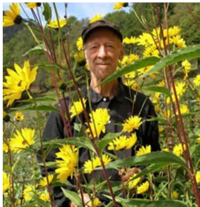
L'écrivain philosophe Yves Paccalet a animé une table ronde samedi 3 juin.

Des spectacles étaient aussi prévus au parc de Sainte-Croix, ainsi qu'une balade à énigmes dimanche à l'arboretum de Réchicourt-le-Château.