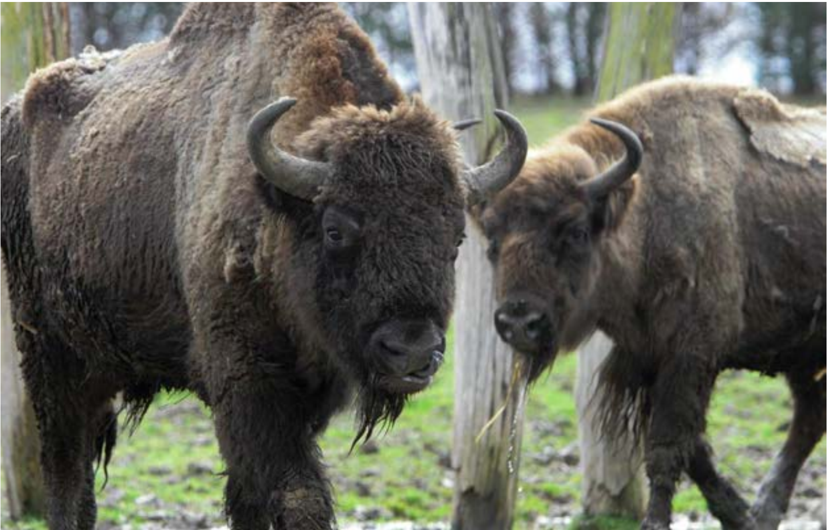
Les bisons d'Europe font partie d'un programme européen d'élevage et de réintroduction progressive en milieu sauvage.