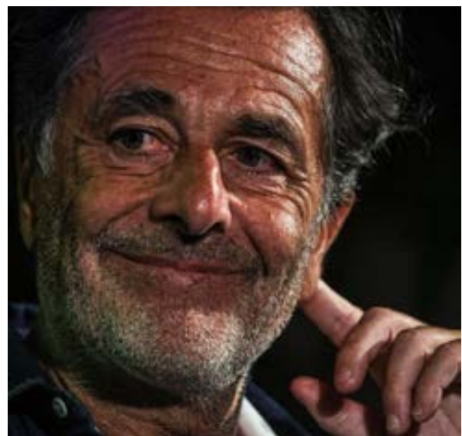
Nicolas Vanier est très inquiet pour l'avenir de la planète.