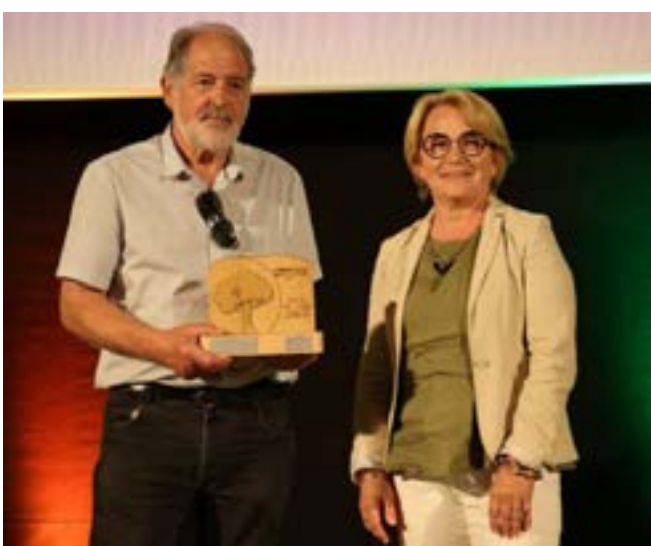
Dans la catégorie appel à initiative citoyenne, le troisième prix revient à Partageons nos valeurs.