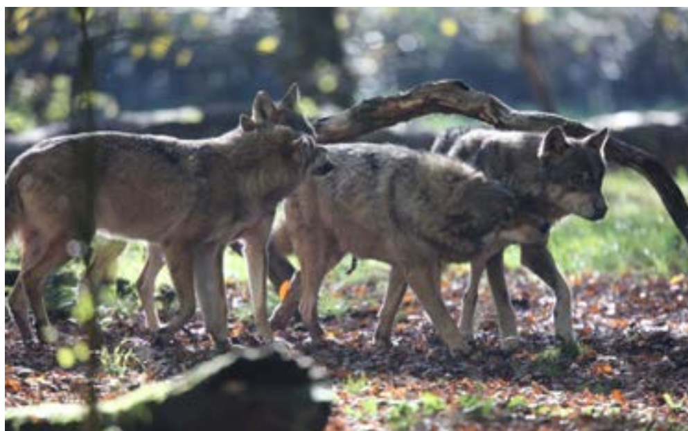
Le loup est un grand carnivore qui joue un rôle écologique majeur dans la régulation des populations d'herbivores sauvages.

« On ne peut pas, pour reprendre le titre des Entretiens de la Biodiversité, réfléchir au retour du sauvage dans notre région sans inclure les grands carnivores. »