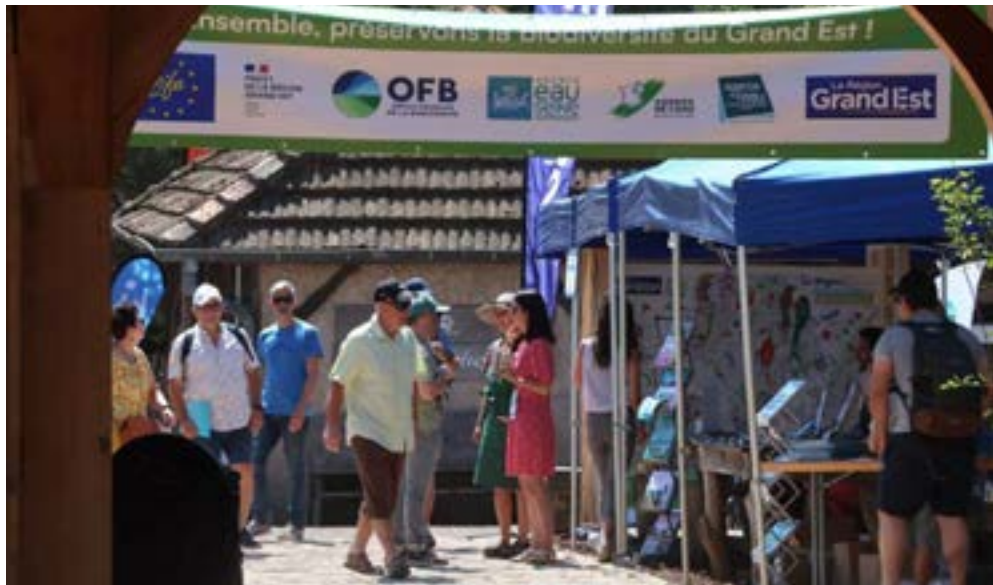
Les partenaires associatifs des Entretiens de la biodiversité ont permis au public d'accéder à de nombreuses informations complémentaires concernant la faune sauvage.

Ce public d'une grande diversité partage au moins un point commun : être amoureux de la nature et de la faune sauvage, se sentir surtout concerné par les difficul-