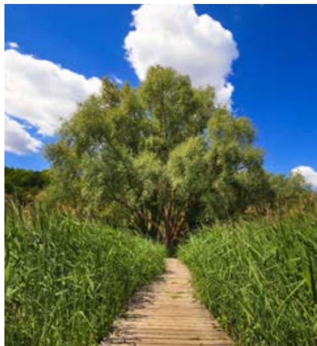
Le marais du Grand Saulcy est un site naturel protégé, à Moulins-lès-Metz, en Moselle.

En une cinquantaine d'années, les deux tiers des zones humides ont disparu. Ces espaces représentent moins de 2 % du territoire alors qu'ils attirent jusqu'à 140 espèces d'oiseaux, soit plus de la moitié des espèces avifaunes de France.