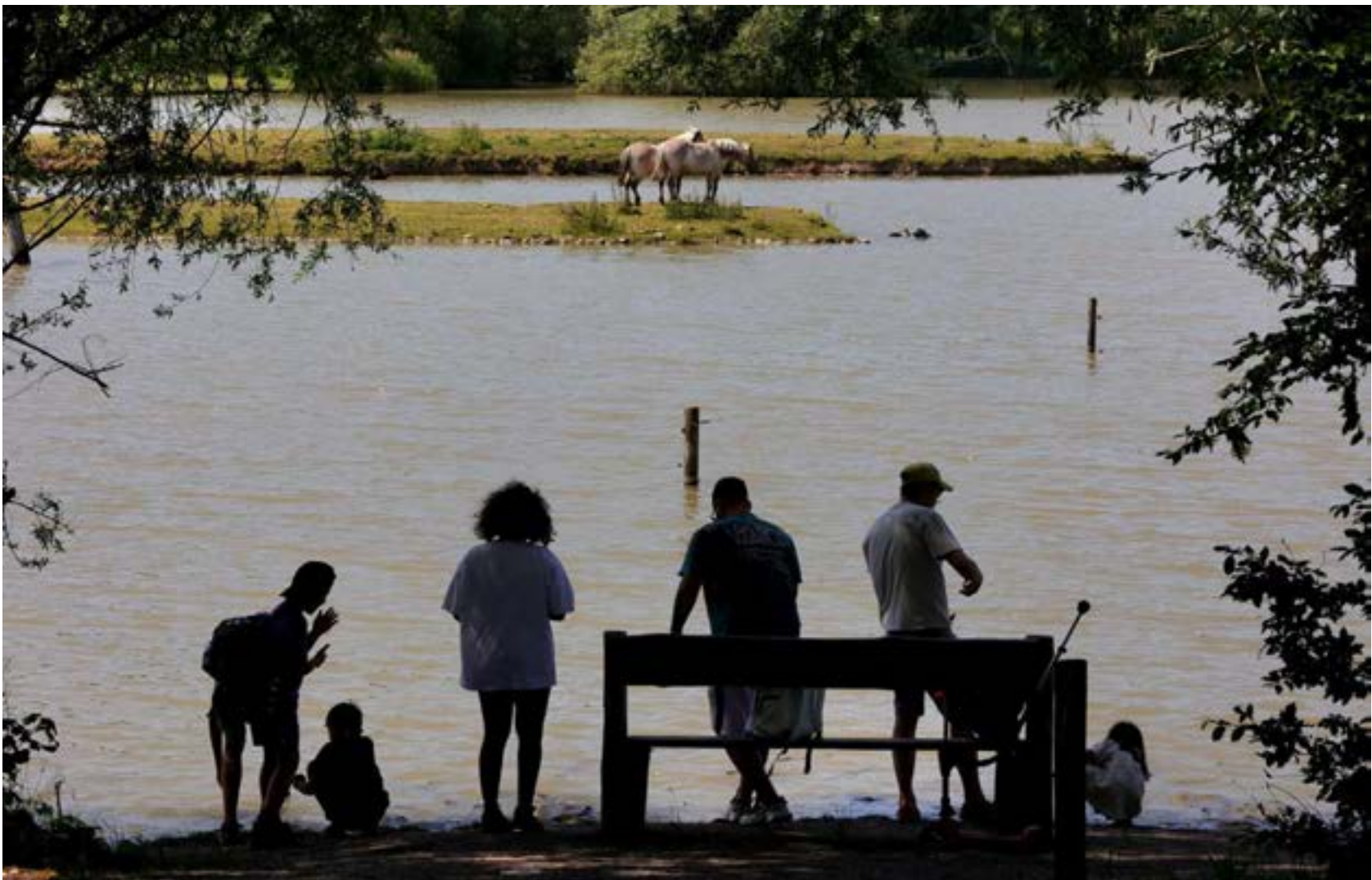
Le public qui s'est déplacé à Rhodes pour participer aux Entretiens de la Biodiversité Grand Est, a également pris plaisir à se promener dans le parc de Sainte-Croix pour admirer les 1 500 animaux qui vivent sur 120 hectares de nature.