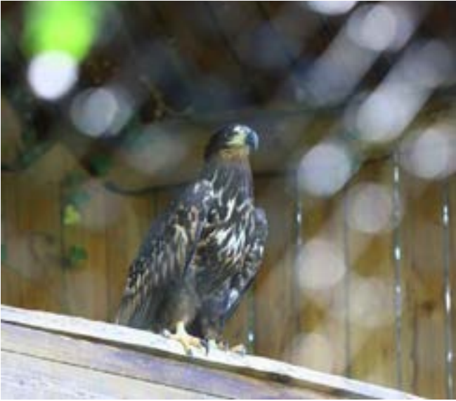
Il n'y a pas encore de pygargue à queue blanche au parc de Sainte-Croix. Mais le projet d'installer une volière de rencontre à Rhodes, avec cet animal, devrait se concrétiser avant la fin de l'année.