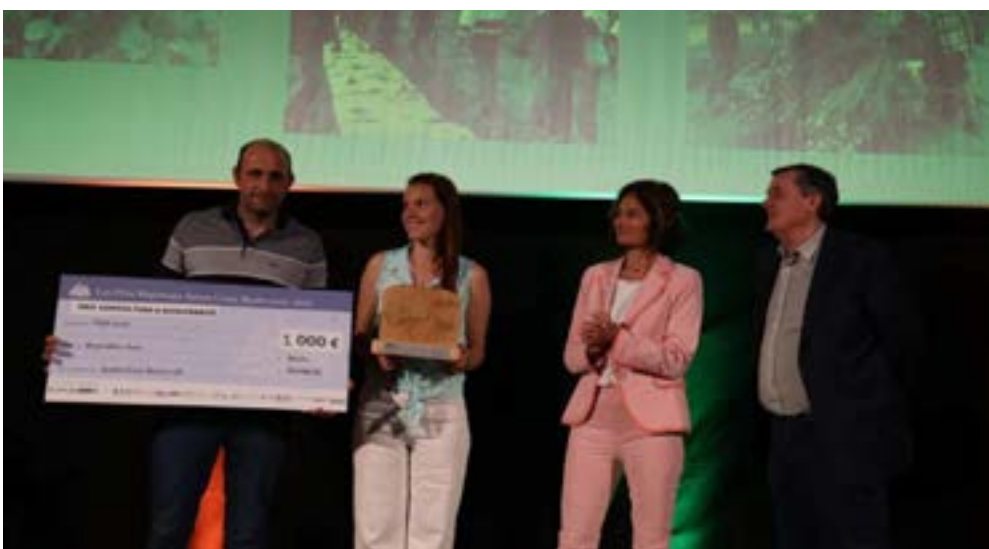
L'association Haies a reçu le deuxième prix Sainte-Croix biodiversité dans la catégorie agriculture et biodiversité.

Prix Roots and shoots, Jane Goodall institut, lycée agricole de Château-Salins. Prix Ici on agit, groupe Ebra : Association haies. Prix Coup de cœur France bleu : Comité agricole du pays toulois.