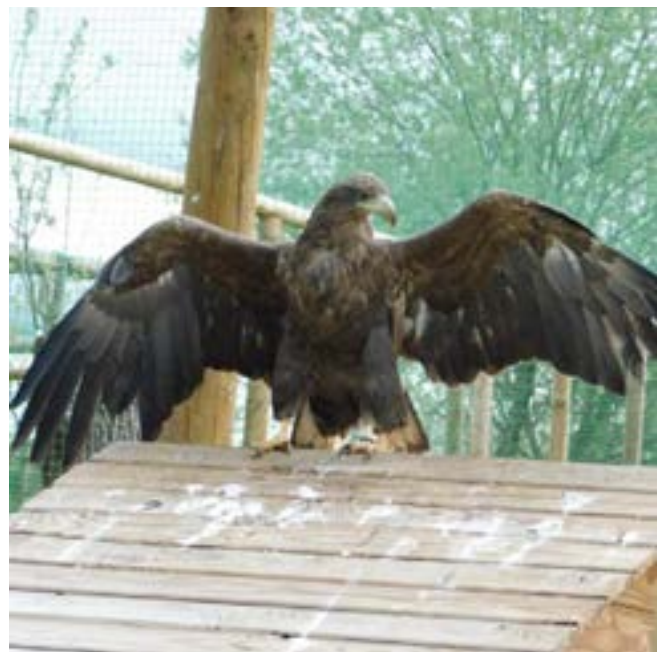
Le pygargue à queue blanche pourrait faire son arrivée au parc de Sainte-Croix à Rhodes cette année pour renforcer ensuite la population sauvage.

Tout dépend aussi de l'évolution de l'habitat. Cette notion est complexe avec des