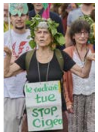
Une manifestation contre Cigéo à Bar-le-Duc.

Pour Nicolas Vanier, le nucléaire est un « mal nécessaire à moyen terme » : « Les menaces terroristes en font des bombes en puissance et on ne sait toujours pas quoi faire de ces déchets. On ne paye pas assez cher l'électricité pour avoir de quoi financer des solutions. Le nucléaire n'est donc pas tenable indéfiniment. Mais il faut absolument continuer à utiliser cette électricité pour éviter le réchauffement et vite mettre en place des alternatives. Je ne peux pas dire que je suis favorable au projet Cigéo. Mais je ne peux pas dire non plus que j'y suis défavorable car il faut bien mettre les déchets quelque part. Où ? Je suis comme tout le monde. Si c'est chez moi en Sologne, je vais hurler. Mais en même temps, je suis bien content d'avoir de l'électricité.