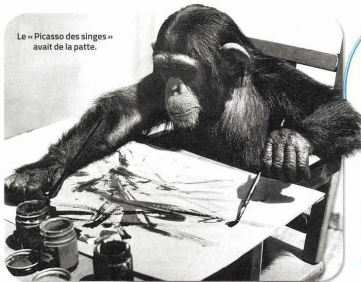
Le « Picasso des singes » avait de la patte.

La primatologue Jane Goodall, qui a vécu parmi les chimpanzés, publie Le Livre de l'espoir , éd. Flammarion.