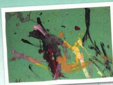
Une de ses productions (mai 1957).