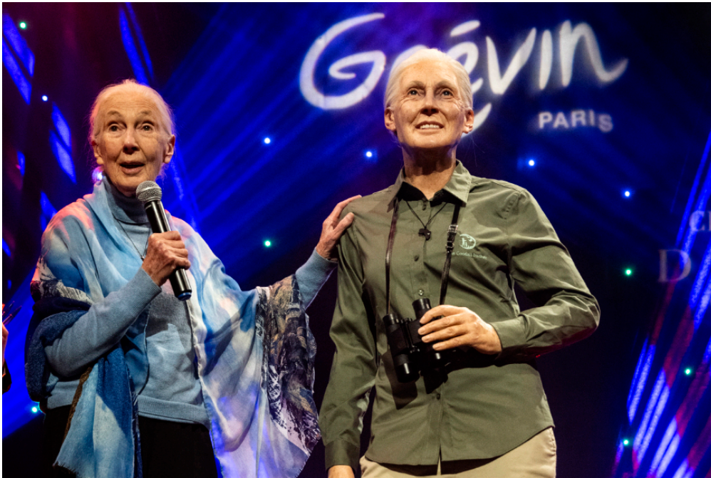
Jane Goodall, en bleu, découvre sa statue, habillée telle que l'était la scientifique quand elle observait les chimpanzés dans la forêt africaine.

Le 1er décembre, le musée Grévin, à Paris, a dévoilé une statue en cire de Jane Goodall, la grande spécialiste mondiale des chimpanzés. Ce musée rend ainsi hommage à cette célèbre scientifique de 89 ans, qui parcourt aujourd'hui le monde pour délivrer un message de respect envers l'environnement.