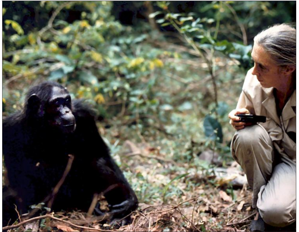
Jane Goodall a passé une grande partie de sa vie au contact direct des chimpanzés dans leur milieu naturel.