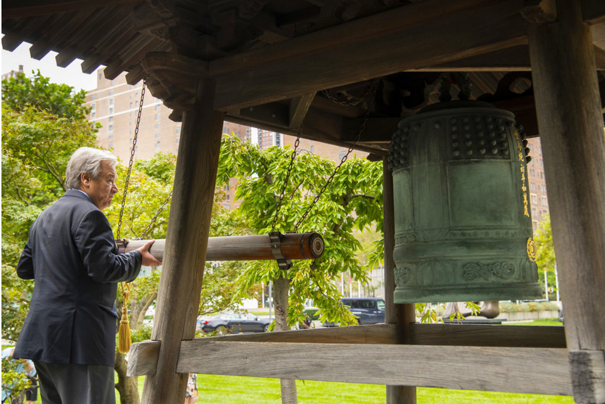
Le Secrétaire général des Nations Unies, António Guterres, sonne la cloche de la paix au siège des Nations Unies à New York.

17 septembre 2020 | Paix et sécurité (/fr/news/topic/peace-and-security)