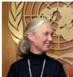
Dr Jane Goodall DBE

Fondatrice du Jane Goodall Institute & Messagère de la Paix auprès des Nations-Unies