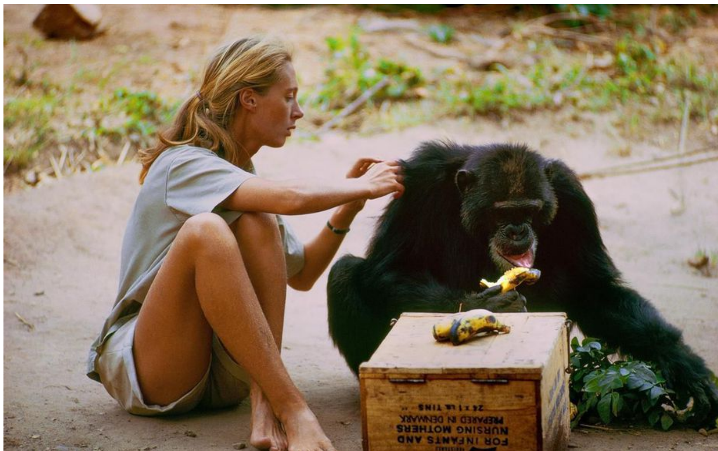
Jane Goodall, aujourd'hui 85 ans, a passé sa vie à sauver les chimpanzés.

Un documentaire sur la vie de l'éthologue Jane Goodall, un autre sur les routes de l'impossible en Sibérie et encore un autre sur les années folles de la télé... Voici le programme télé de ce vendredi soir.